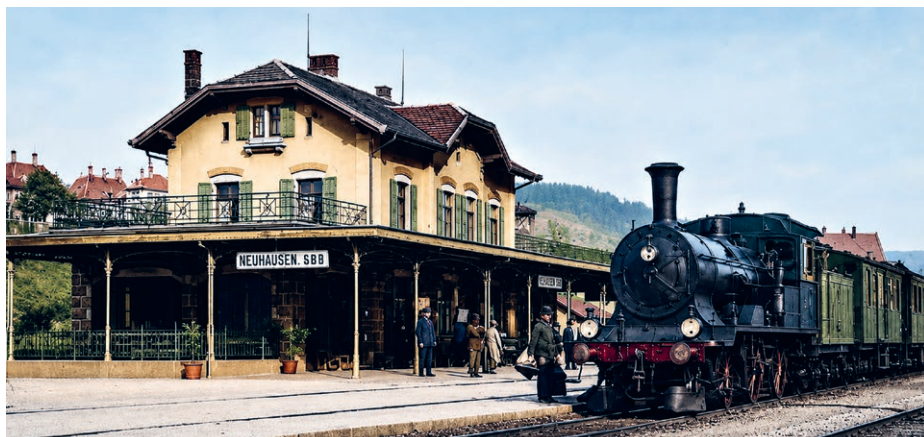
Bis 1943 fuhren zum Teil noch Dampflokomotiven durch den Bahnhof Neuhausen. (Bild Otto Beutel, nachkoloriert)

Als 1857 die erste Eisenbahn über die Rheinfallbrücke donnerte, gingen die Neuhauser leer aus: Die Züge fuhren einfach an unserem Dorf vorbei. Erst 40 Jahre später erhielt Neuhausen am Rheinfall seinen «schweizerischen» Bahnhof. von Martin Harzenmoser