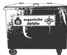
Container 770 / 800 l (Schweizer Norm)

Auch zu 100 % kompostierbare Säcke 1 müssen in die aufgeführten Behälter entsorgt werden. Andere Gebinde oder Behälter (wie z.B. Körbe und Kompostiereimer) werden nicht geleert.