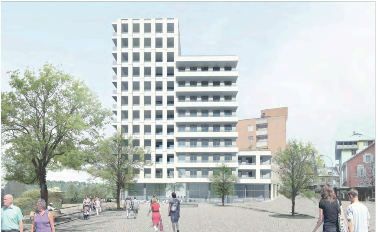
Abb. 1: Visualisierung des Projekts «Neighborhood» vom Industriplatz aus gesehen

Dazu wurde ein Studienauftrag durchgeführt, aus welchem das Projekt «Neighborhood» der Architektengemeinschaft Tony Fretton Architects, London/Blättler Dafflon, Zürich als Sieger hervorging (Visualisierung siehe Abb. 1).