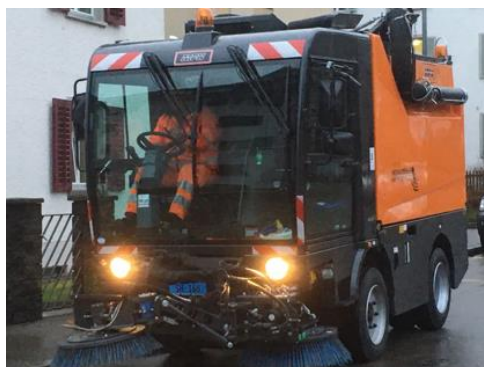
MFH CS 555

Sie hatten heute Abend die Gelegenheit zu sehen, was dieses Gerät kann. Es ist nicht das Schweizer Sackmesser, das alles kann, aber es kann vieles und ich hoffe, Sie haben auch den Eindruck bekommen, dass die Leute davon begeistert sind und dass es auch ein ausgezeichnetes Fahrzeug ist.